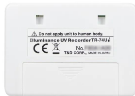
画像は、商品背面のイメージです。