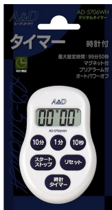
画像は、個包装のイメージです。