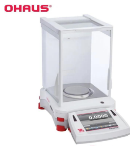
写真は、シリーズ代表画像です。