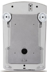
画像は、商品底面のイメージです。