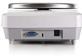
画像は、商品背面のイメージです。

明るく、読みやすいバックライト付きディスプレイと直感的操作が可能なユーザーインターフェイス