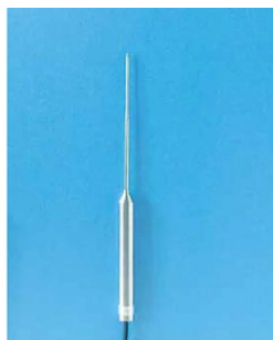
画像は、センサのイメージです。