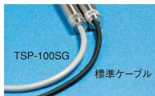
画像は、ケーブルの比較イメージです。