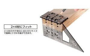
シンワ 測定株式会社 画像は、商品の使用イメージです。