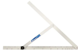
シノワ 測定株式会社 画像は、商品イメージです。