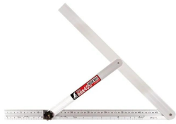
シンワ 測定株式会社