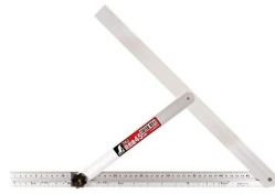
シノワ 測定株式会社 画像は、商品イメージです。