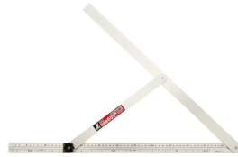
シノワ 測定株式会社 画像は、商品イメージです。