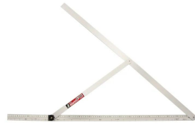
シノワ 測定株式会社 画像は、商品イメージです。