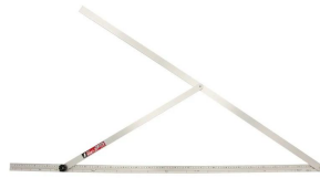
シノワ 測定株式会社 画像は、商品イメージです。