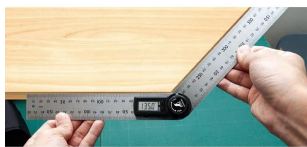
シノワ 測定株式会社 画像は、商品の使用イメージです。