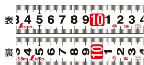
高さ測定に便利な裏面目盛付