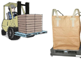
画像は、計量作業のイメージです。