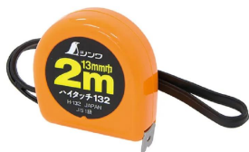
シンワ 測定株式会社 画像は、商品イメージです。