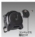
コンベックス 取付コマ

コンベックス取付コマを付けることでマグネットが引きつけ合い、吸い付くように正面から装着できます。