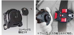
シムズ 測定株式会社

コンベックス取付コマを付けることでマグネットが引きつけ合い、吸い付くように正面から装着できます。