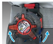
シムズ 測定株式会社