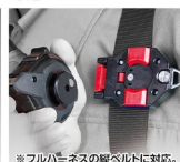
※フルハイスの軽ベルトに対応。