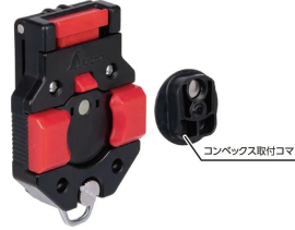
シムズ 測定株式会社