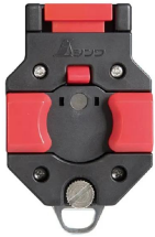
シムズ 測定株式会社