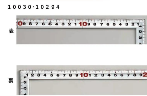
画像は、目盛のイメージです。