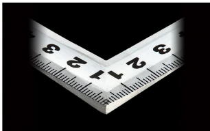
シンワ 測定株式会社 画像は、角厚のイメージです。