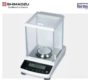
Amidia 画像は、ロゴマークなどの付いた商品イメージです。