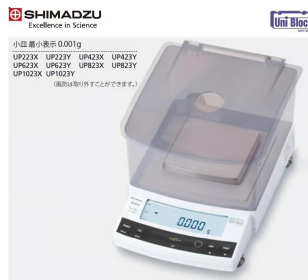
画像は、ロゴマークなどの付いた商品イメージです。