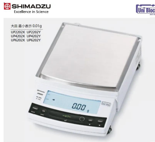
画像は、ロゴマークなどの付いた商品イメージです。