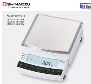
画像は、ロゴマークなどの付いた商品イメージです。