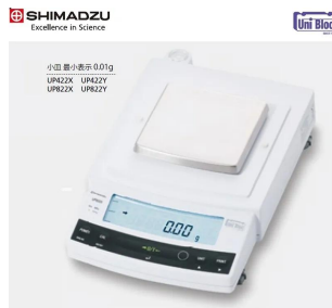
画像は、ロゴマークなどの付いた商品イメージです。