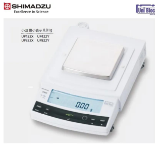
画像は、ロゴマークなどの付いた商品イメージです。