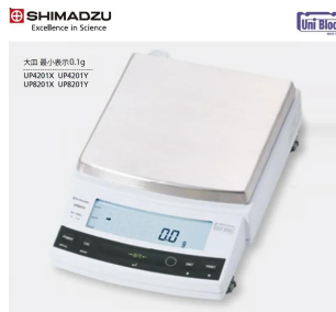
画像は、ロゴマークなどの付いた商品イメージです。