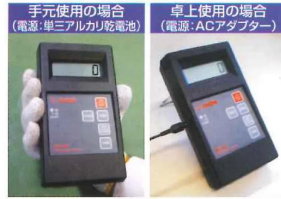
手元使用の場合 (電源:単三アルカリ乾電池)