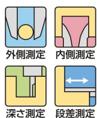
外側測定 内側測定 深さ測定 段差測定