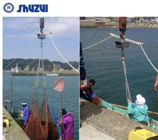
画像は、岸壁・船上での使用イメージです。