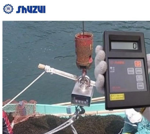
画像は、リモコンの使用イメージです。