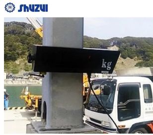
画像は、オプションにある大型表示のイメージです。