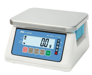
画像は、オプションのステンレス皿を装着したイメージです。