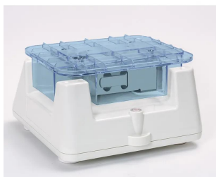
画像は、本体背面 (計量皿を取り外した状態) のイメージです。