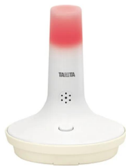
画像は、熱中症の危険を知らせる光が点灯したイメージです。