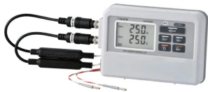
CH1: SK-L753-1 センサ CH2: SK-L753-2 センサ ※センサは別売ります