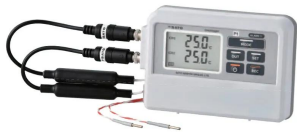
CH1: SK-L753-1 センサ CH2: SK-L753-2 センサ ※センサは別売ります