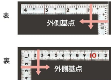
画像は、目盛のイメージです。