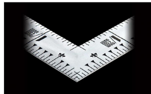
画像は、直角のイメージです。