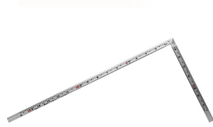
画像は、商品表面のイメージです。