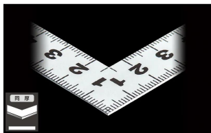
画像は、直角のイメージです。