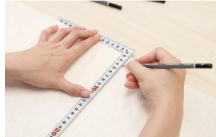
画像は、商品の使用イメージです。