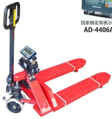
国家検定用表示器 AD-4406A