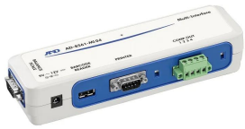
株式会社エー・アンド・デイ 画像は、商品イメージです。