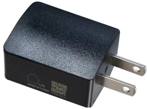
株式会社 エー・アンド・デイ