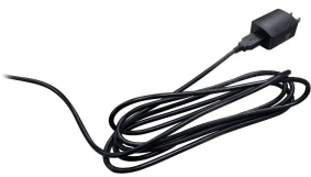
株式会社 エー・アンド・デイ