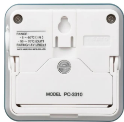
画像は、商品背面のイメージです。