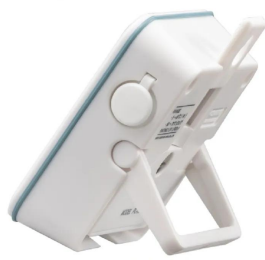
画像は、スタンド設置のイメージです。