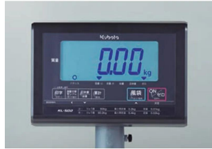
株式会社 Kubota 計装 株式会社 Kubota (国産計装事業部) 画像は、表示部のイメージです。