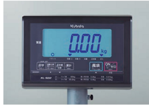
株式会社クボタ計装 (株) 株式会社クボタ (株) 株式会社クボタ (株) 株式会社クボタ (株) 画像は、表示部のイメージです。