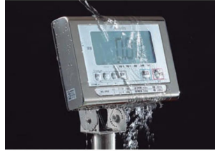
特約会社クボタ計装 特約会社クボタ (国産計装標準ユニット) 画像は、表示部のイメージです。