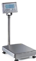
写真は、シリーズ代表画像です。：K L-I P 2-K 6 0 A