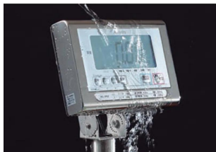
特約会社クボタ計装 特約会社クボタ (国産計装標準ユニット) 画像は、表示部のイメージです。