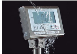
株式会社クボタ計装 株式会社クボタ (国産計装事業ユニット) 画像は、表示部のイメージです。