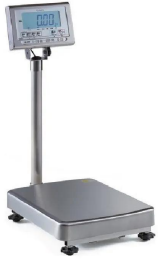
写真は、シリーズ代表画像です。：K L-I P 2-K 6 0 A