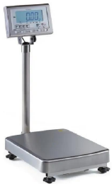
写真は、シリーズ代表画像です。：KL-I P 2-K 6 0 A