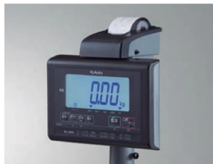
株式会社クボタ計装 株式会社クボタ 画像は、K L-S D 2 にジャーナルプリンタを取付けたイメージです。