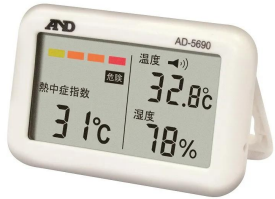
株式会社 エー・アンド・デイ