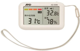
株式会社 エー・アンド・デイ