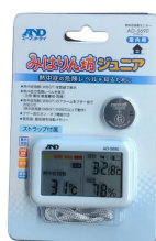
株式会社 エー・アンド・デイ