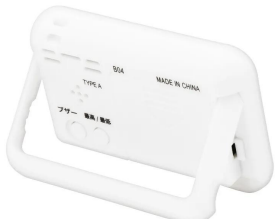
株式会社 エー・アンド・デイ