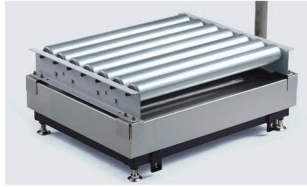
株式会社 Kubota (国産) 計量台用ヨコの商品イメージです。