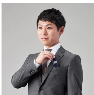
ポケットに収まるサイズ