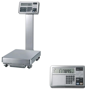
写真は、シリーズ代表画像です。表示器 i 0 2 のイメージは右下です。