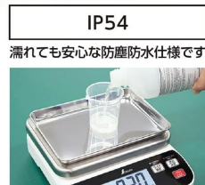
※画像は「70041」です。 シンワ測定株式会社 画像は、使用イメージです。