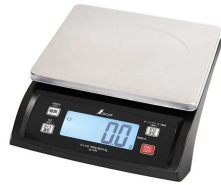
画像は、商品イメージです。