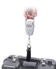
画像は、使用イメージです。 シンワ測定株式会社