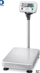
写真は、商品イメージです。