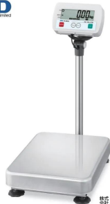
写真は、商品イメージです。